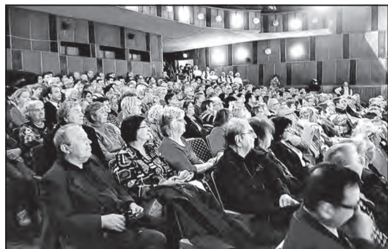
▲ Частина глядачів.

тили дитяча фольклорна група при З'єднаній школі ім. Тараса Шевченка у Пряшеві «Сердечко», музичний оркестр ансамблю «Шаришан», жіноча співацька група цього ансамблю та танцювальний колектив «Карпатянин».