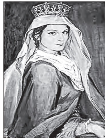
▲ Портрет (уявний) Вишеслави Святославни.

Польські джерела не називають ні імені, ні походження дружини Болеслава II, через що польські історики цієї версії не сприймають. За Я. Длугошем, дружину Болеслава II Сміливого звали Вишеславою і вона була єдиною дочкою руського князя. Ці відомості не суперечать джерелу В. Татищева: збігається також і час шлюбу польського князя.